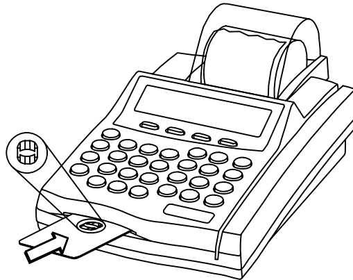
שימוש בכרטיס חכם